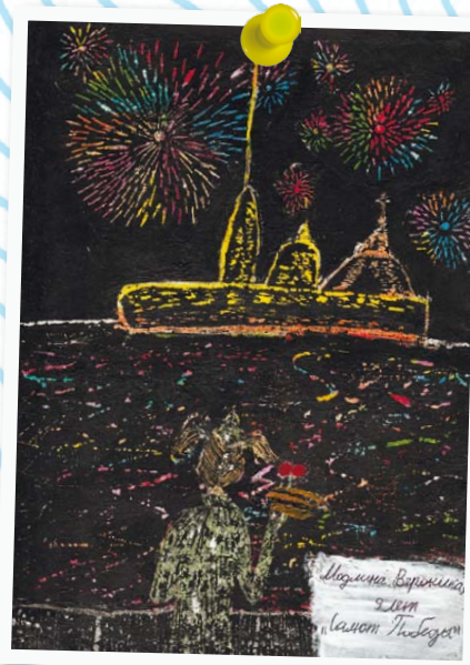
Модлина Вероника 9 лет