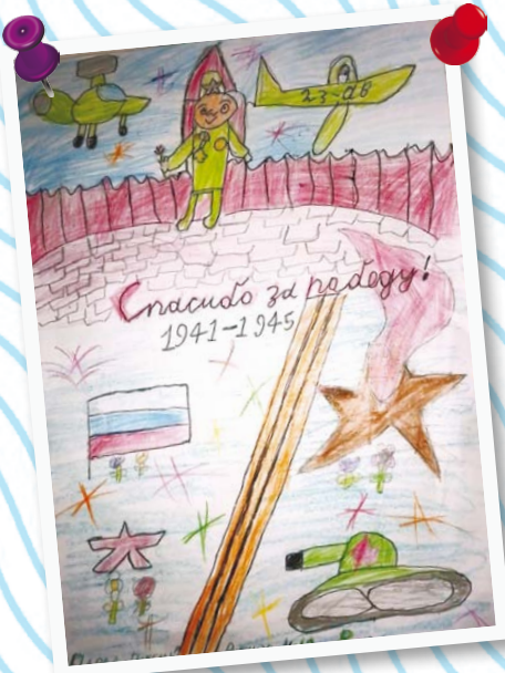
Рубцов Илья 8 лет