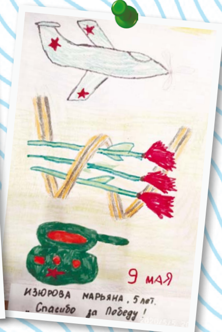
Изюрова Марьяна 5 лет