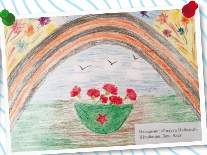
Щербаков Лев 5 лет