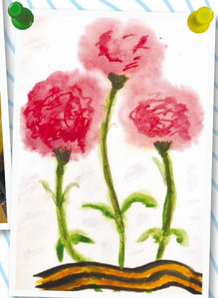
Оземский Глеб 8 лет